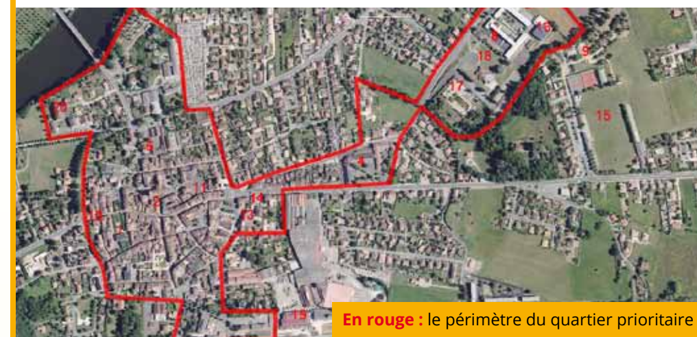
En rouge : le périmètre du quartier prioritaire

La loi sur la cohésion urbaine et la politique de la ville du 21 février 2014 a défini la nouvelle géographie prioritaire de la politique de la ville en déterminant 1300 quartiers, dévoilés en juin 2014. Parmi ces derniers figuraient de nouveaux sites entrants situés dans des zones rurales et des villes moyennes. Sept quartiers prioritaires ont ainsi été identifiés dans le Lot-et-Garonne dont deux au sein de la Communauté d'Agglomération du Grand Villeneuvois : les bastides de Villeneuve sur Lot (2530 habitants) et de Ste Livrade sur Lot (1190 habitants).