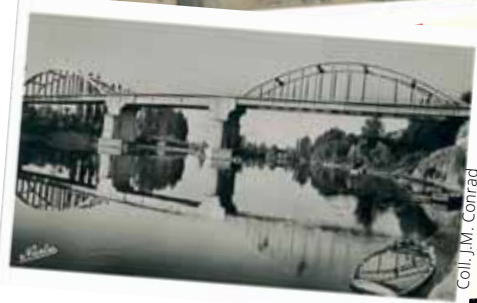
Coll. J.M. Conrad