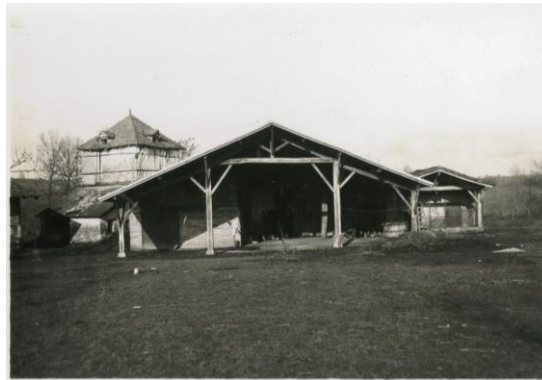
Ferme Sirech - AD ,47. 3 U 4 / 400