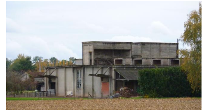
Vestiges d'une casemate, lieu-dit Septfonds

Qu'importe, les fermes sont évacuées et le terrain rapidement « nettoyé ». Les bâtiments et la végétation dont beaucoup d'arbres plus que centaines disparaissent.