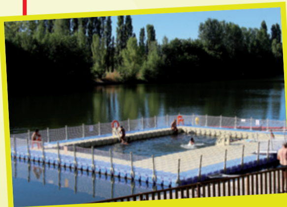
Une nouveauté : une piscine sur le Lot