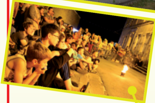
Beaucoup de monde pour la fête des communautés le 15 juillet