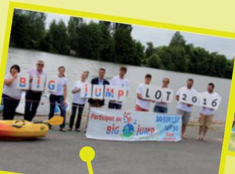
Tous à l'eau avec le Big Jump 10 juillet