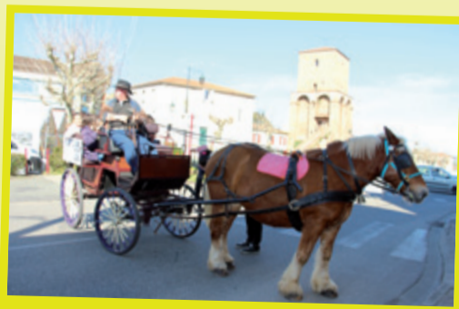
NOUVEAU : Tous les vendredis matins des balades en calèche gratuite