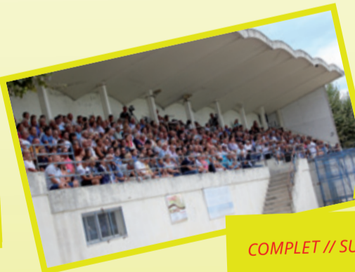
COMPLET // SUA-Albi le 19 août au stade