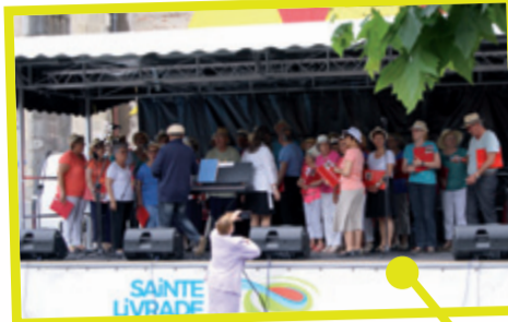
Une réussite pour la 1 re édition de la fête des familles le 19 juin