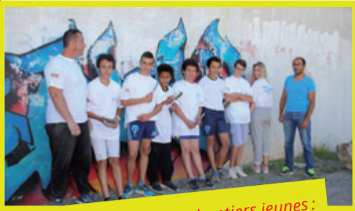
Un nouveau défi pour les chantiers jeunes : un graff au gymnase