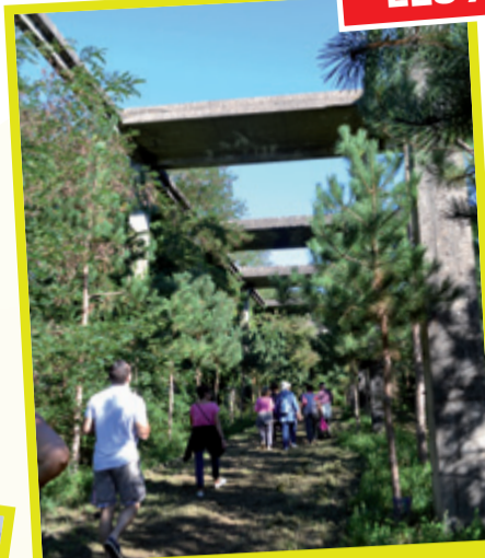
Visite de la poudrerie avec le conteur de pays M. Fillol